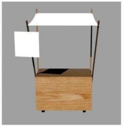
입식매대 테이블 기준 (가로 1,000 * 세로 600 * 높이 700MM)