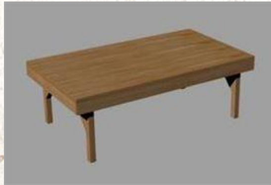
좌식매대 테이블 기준 (가로 1,400 * 세로 800 * 높이 450MM)