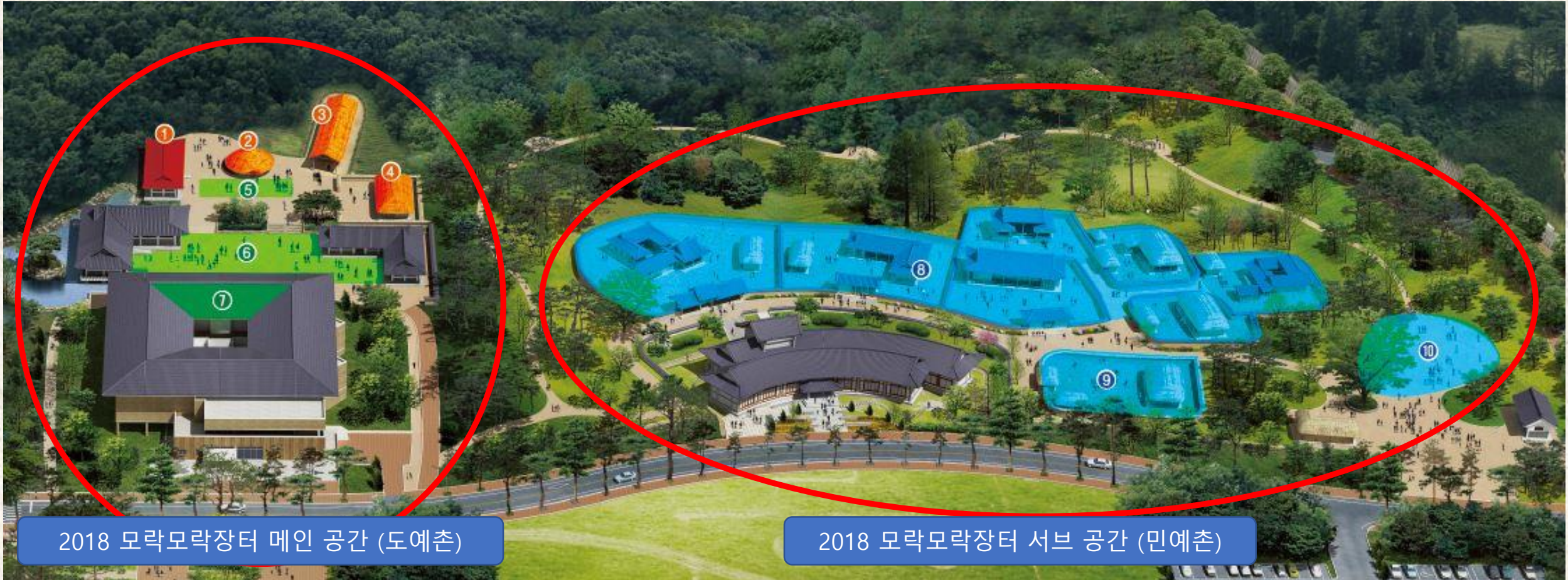
2018 모락모락장터 메인 공간 (도예촌)