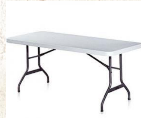
일반행사 테이블 (가로 1,800 * 세로 700 * 높이 600MM)